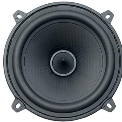
EX 130 PHASE EV03