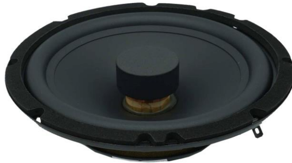
AS 165 DC FL EVO